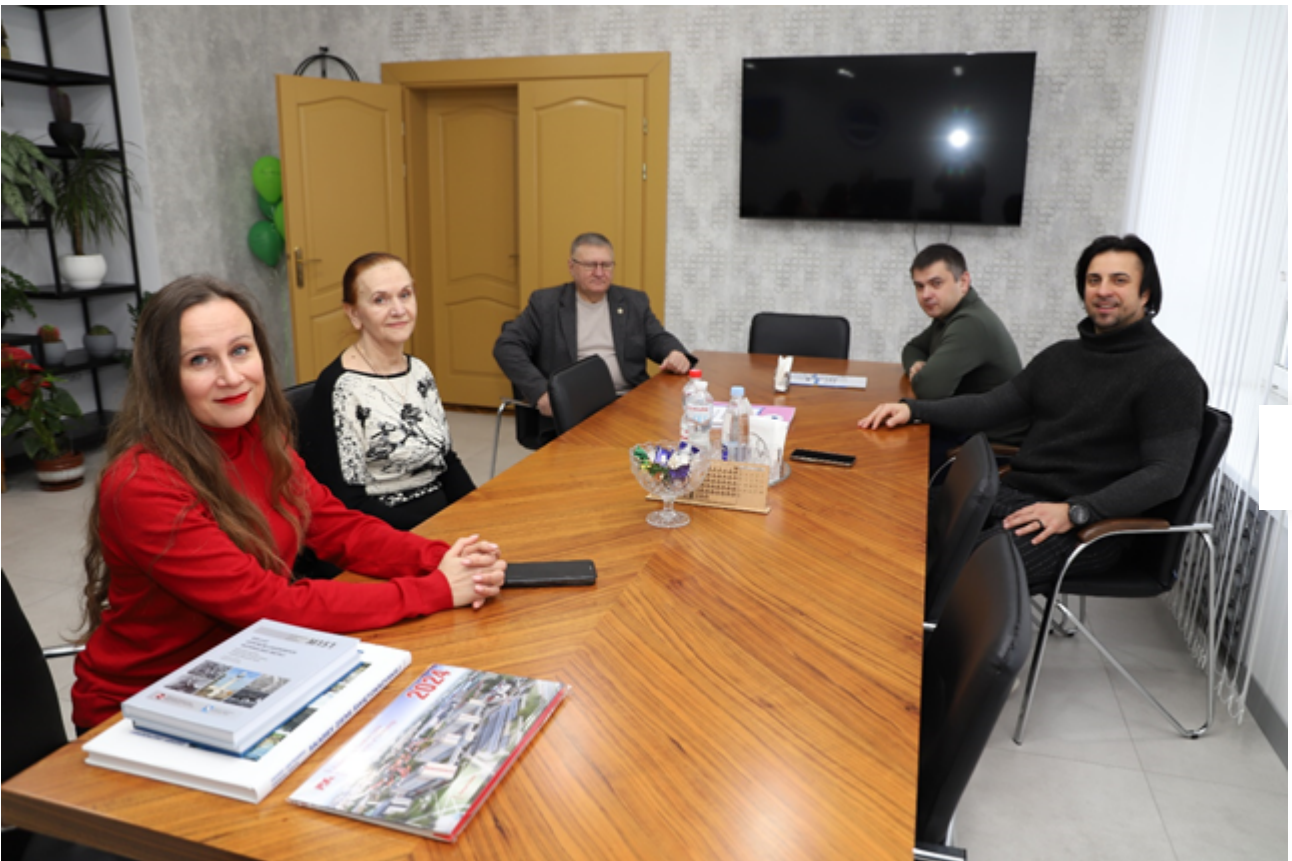
Відділ зв'язків з громадськістю

Загальні питання: centr@khnmu.edu.ua Публікація матеріалів: press@khnmu.edu.ua