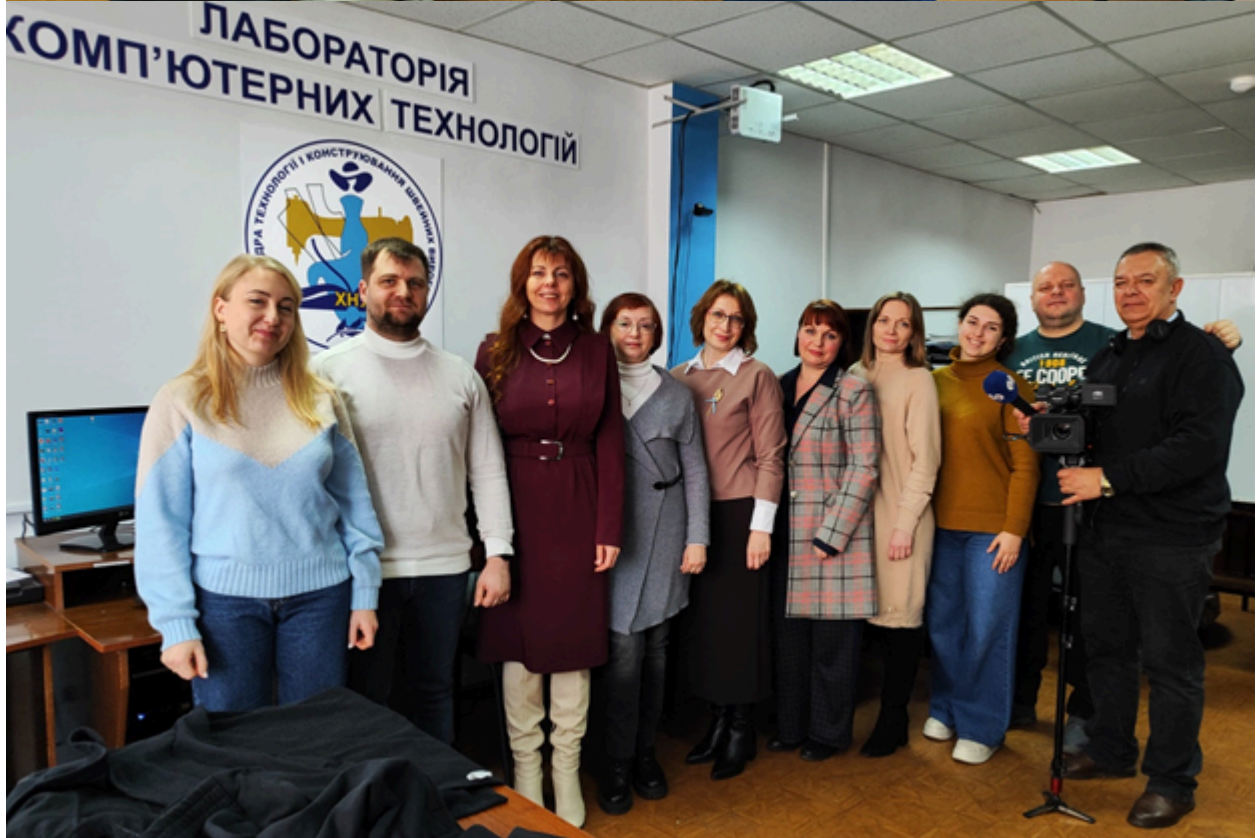
Інформація кафедри технології і конструювання швейних виробів