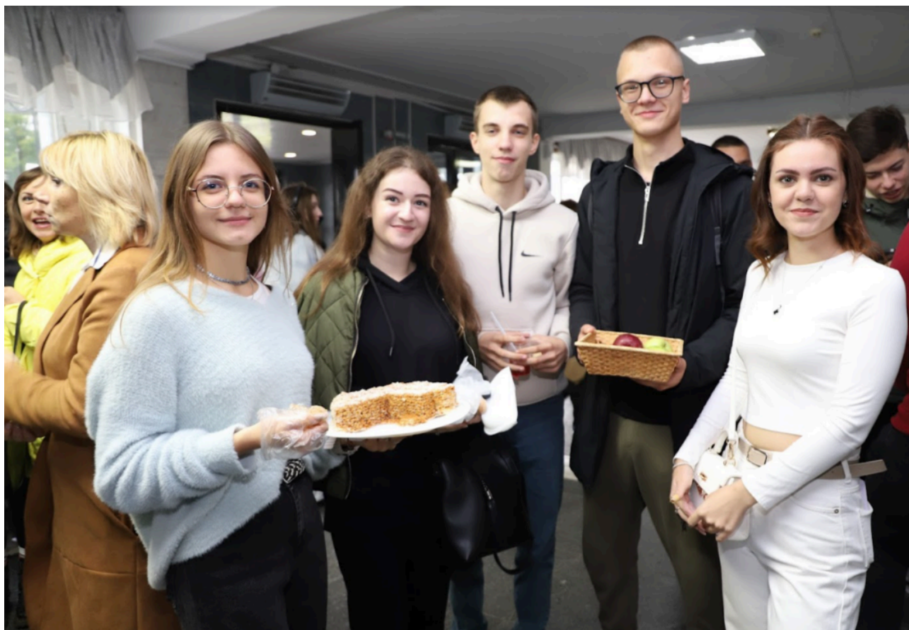
Родзинкою нашого заходу стала смажена свинина, приготовлена на відкритому вогні за фірмовим рецептом доцента кафедри технологічної та професійної освіти і