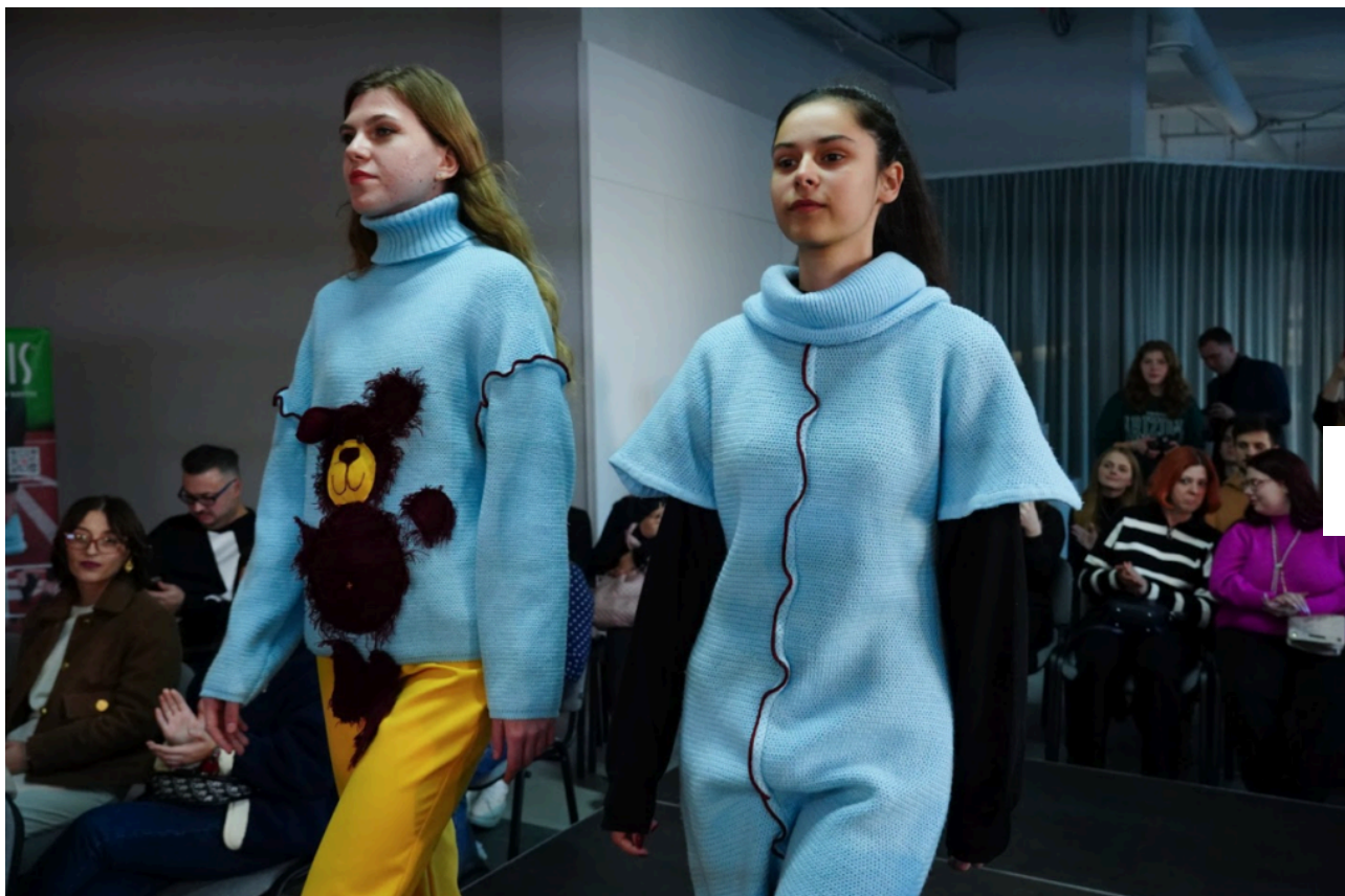
Колекція «Де живуть ведмеді» (автор: Тетяна Гарматюк)

Загалом презентований проєкт дозволить молоді отримати нову кваліфікацію та необхідні навички для створення власного бізнесу або розвитку уже діючої справи. Фахові тренери протягом навчання ділитимуться не тільки теоретичними знаннями, але й реальними прикладами реалізації успішних бізнес-проєктів авторами та реалізаторами яких є креативна молодь.