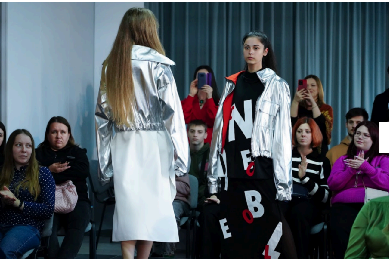
Колекція «Be yourself» (автори: Ілона Поплавська, Анастасія Гаюр, Наталія Ліщенко, Наталія Решетник)