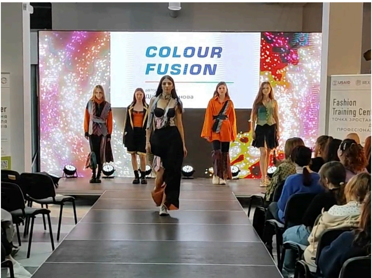
Колекція «Colour Fusion» (автор: Діана Хасанова)