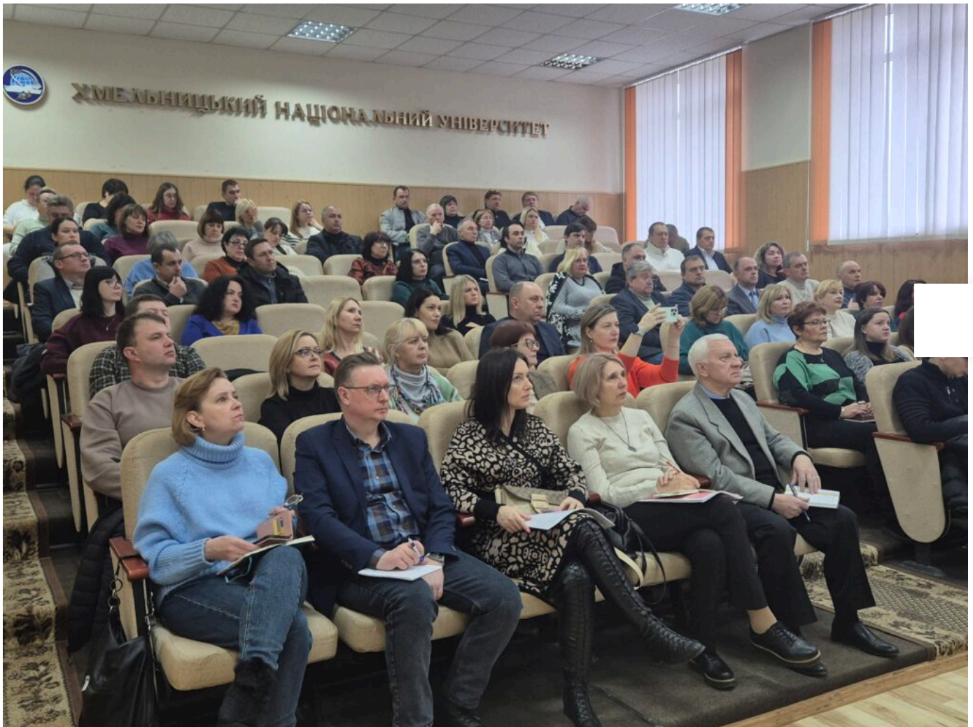
Центр післядипломної освіти

Загальні питання: centr@khnmu.edu.ua Подача новин та анонсів: press@khnmu.edu.ua