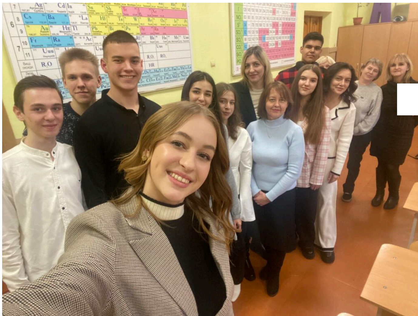
Кафедра хімії та хімічної інженерії

розвитку науки серед молоді, але й підвищує імідж кафедр та університету, залучаючи до них активних і зацікавлених учнів.