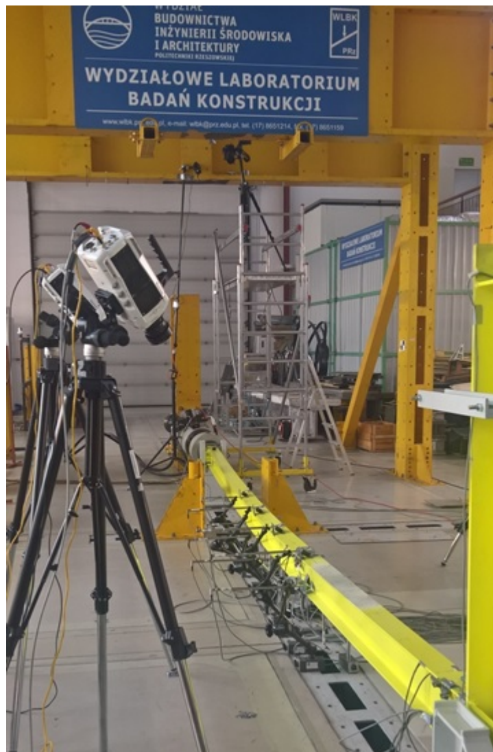
У лабораторії дослідження будівельних конструкцій

Візит делегації факультету інженерії, транспорту та архітектури Хмельницького національного університету до Жешувської політехніки став кроком у зміцненні співпраці між навчальними закладами. Поглиблене взаєморозуміння між університетами створило міцне підґрунтя для розвитку тривалого партнерства,